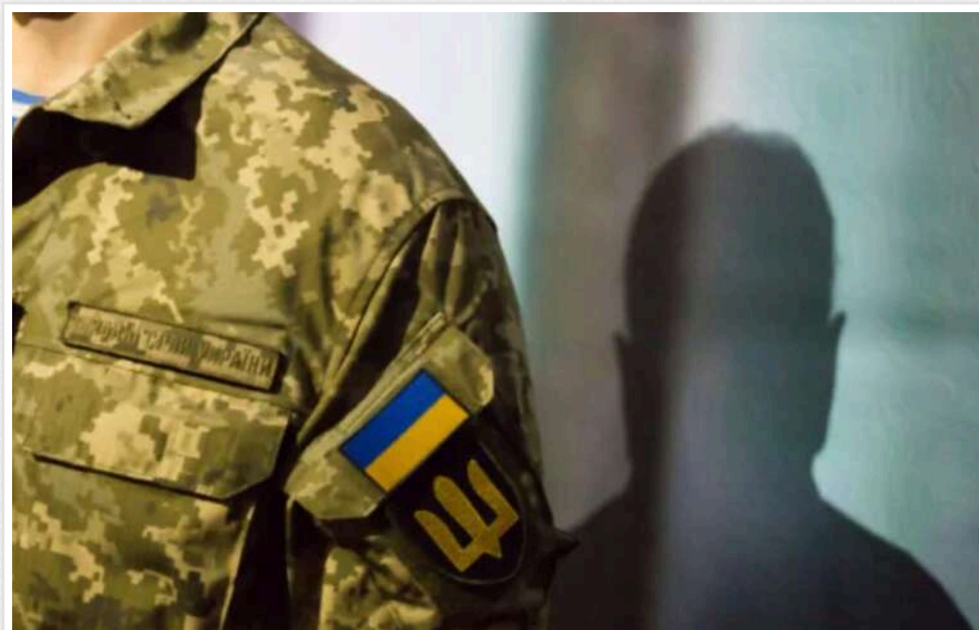
Чоловік залишив підрозділ ЗСУ через конфлікти з командиром і вживання наркотиків

Чоловік добровільно пішов на війну, а через рік отримав вирок у справі про наркотики. Командир був незадоволений поведінкою військового, тому той вирішив залишити частину.