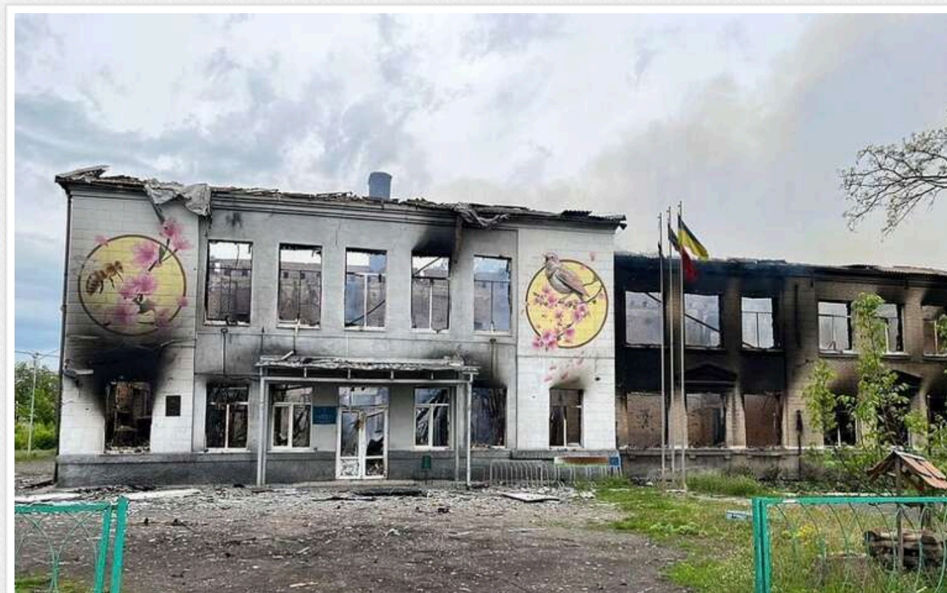
За останні 4 роки в Україні було закрито 2114 шкіл