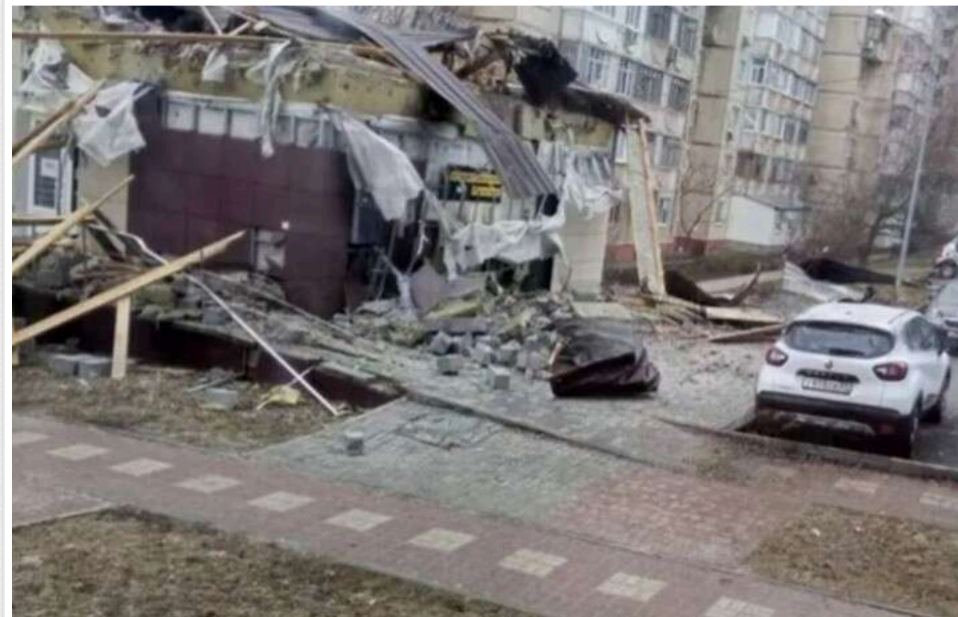
На третьому році війни росіяни занепокоїлися щодо "СВО" та висловили обурення, що влада їх "кинула"

Третій рік війни в Україні виявився ключовим для багатьох росіян, які почали відкрито висловлювати своє невдоволення становищем у країні. Обговорення з приводу безпеки та відсутності укриттів стали невід'ємною частиною повсякденного життя громадян країни-агресорки.