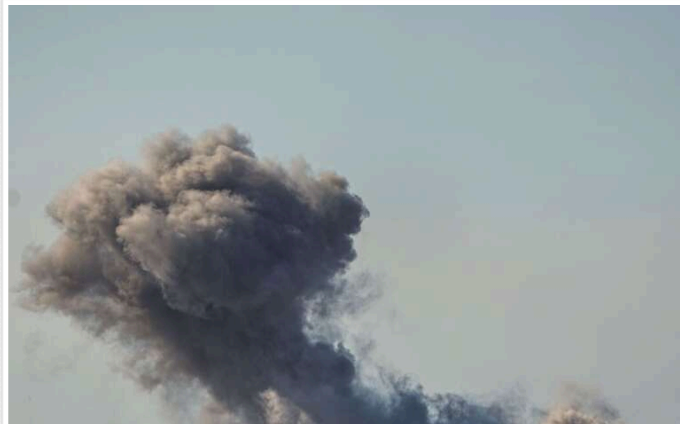
У Харкові лунали вибухи: росіяни атакували місто КАБами

Сьогодні, 24 жовтня, російські військові здійснили атаку на Харків. У місті було чути серію вибухів.