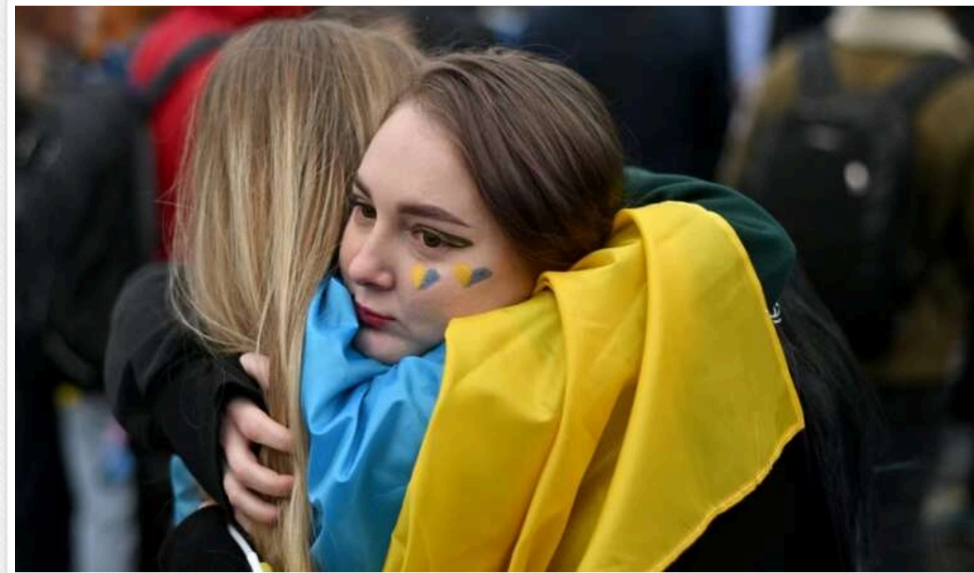
35% українців хочуть переговорів із Росією вже зараз, 48% проти — опитування

Про це йдеться в опитуванні центру Разумкова.