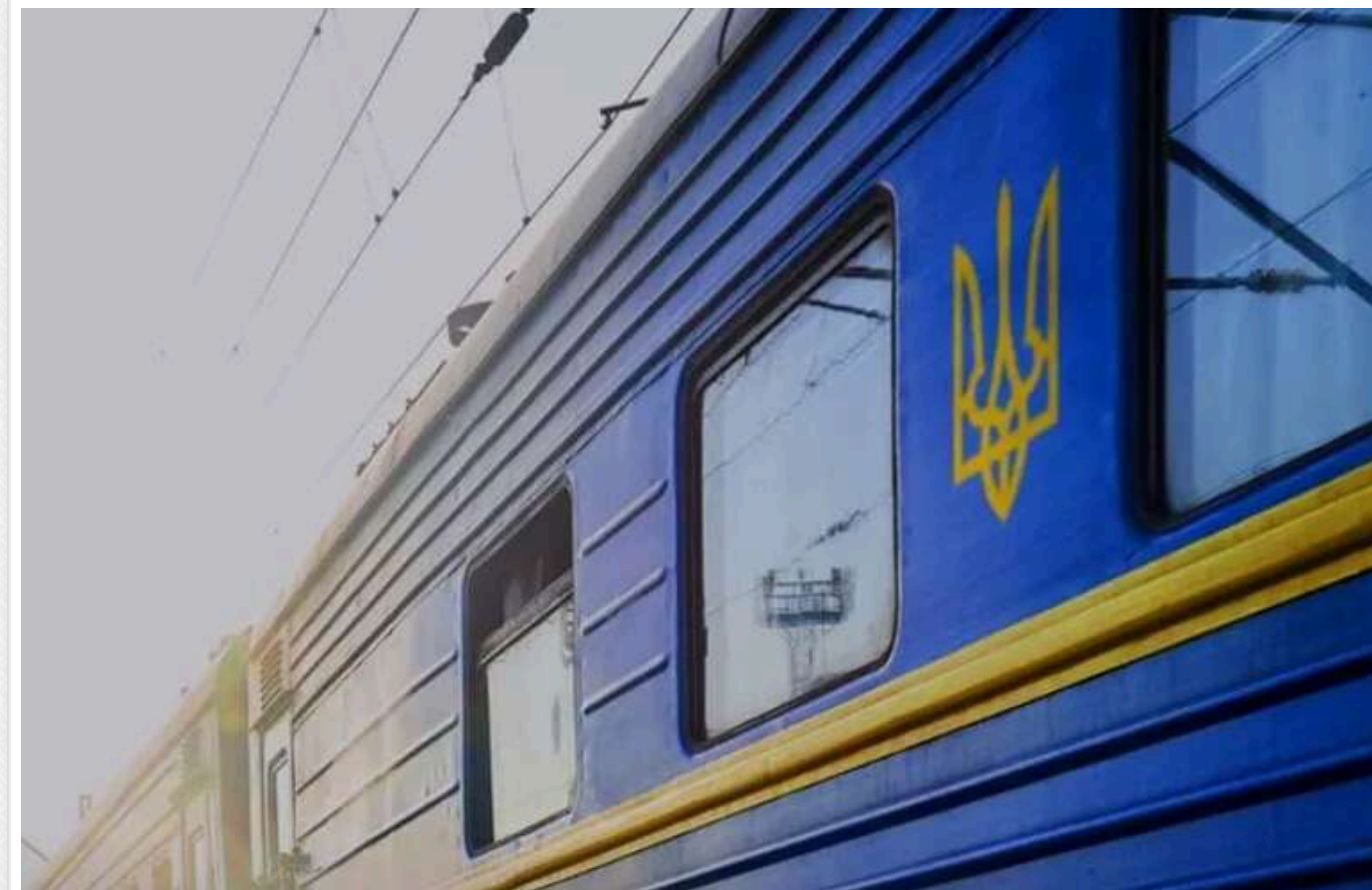
"Укрзалізниця" запустила "спеціальний" поїзд за популярним маршрутом

"Укрзалізниця" організувала новий потяг між Києвом і Кам'янцем-Подільським. Це стало можливим завдяки зростанню попиту на квитки в цьому напрямку. Однак, потяг буде тимчасовим – рейси відбудуться лише в окремі дні наприкінці жовтня. Вартість квитків на плацкарт (на рейс 31 жовтня з Києва) у цьому поїзді складає 214,93 грн.