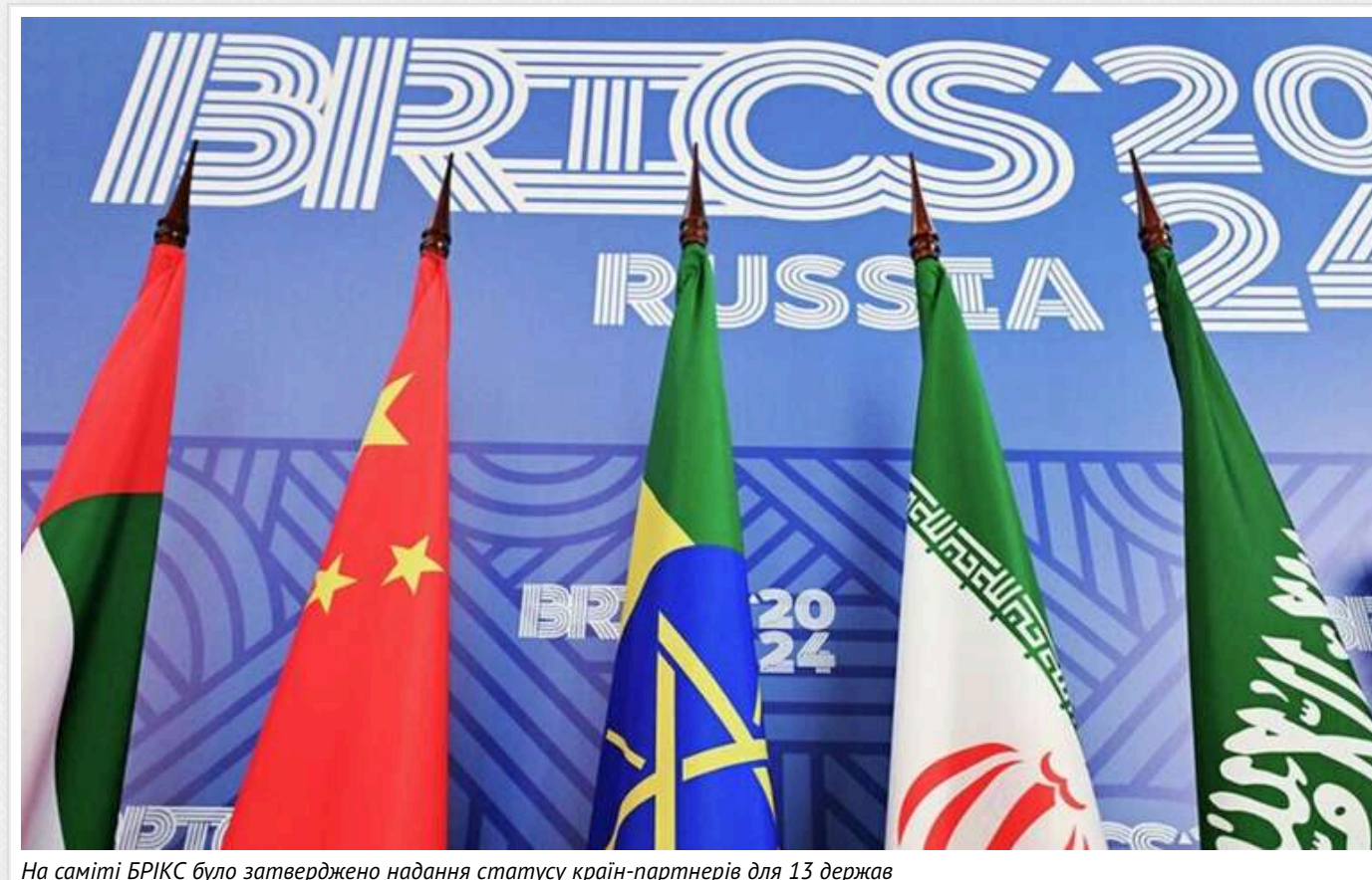
На саміті БРІКС було затверджено надання статусу країн-партнерів для 13 держав

До них приєдналися Туреччина, Казахстан, Узбекистан, Алжир, Білорусь, Болівія, Куба, Індонезія, Малайзія, Нігерія, Таїланд, Уганда і В'єтнам.