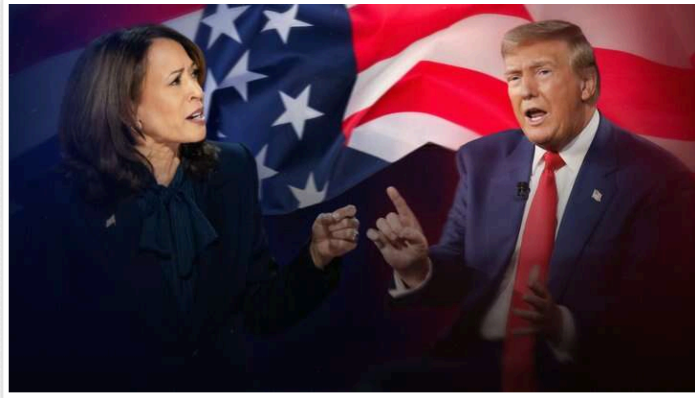
Відрив між Дональдом Трампом і Камалою Гарріс знову скоротився — опитування The Wall Street Journal

Згідно з опитуванням, яке проводилося з 19 по 22 жовтня, за республіканця готові проголосувати 47% опитаних виборців, за демократку — 45%.