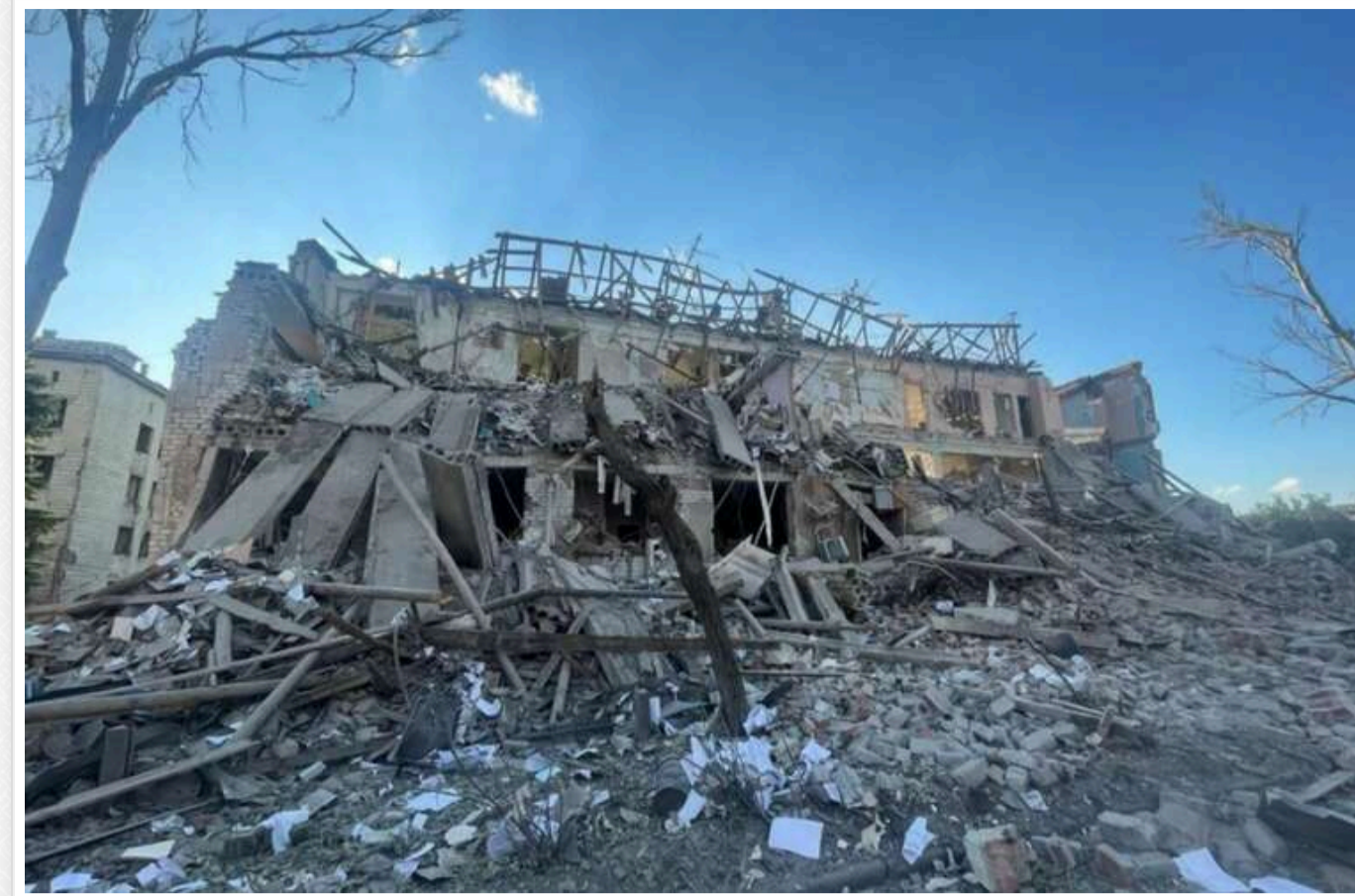
У Селидово на цю мить бої йдуть за кожен будинок, - військовий