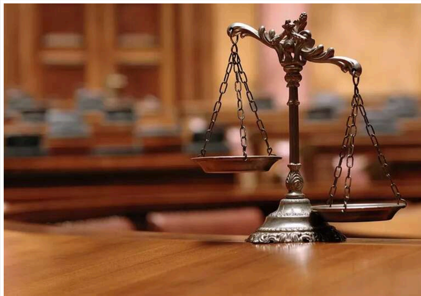
Суд засудив 52-річного жителя Харкова до трьох років тюрми за те, що він не відреагував на отриману бойову повістку

Як впливає з судових матеріалів, у липні 2023 року чоловік пройшов лікарсько-лікарську комісію, яка визнала його придатним для служби, і отримав повістку, проте він не з'явився до територіального центру комплектування.