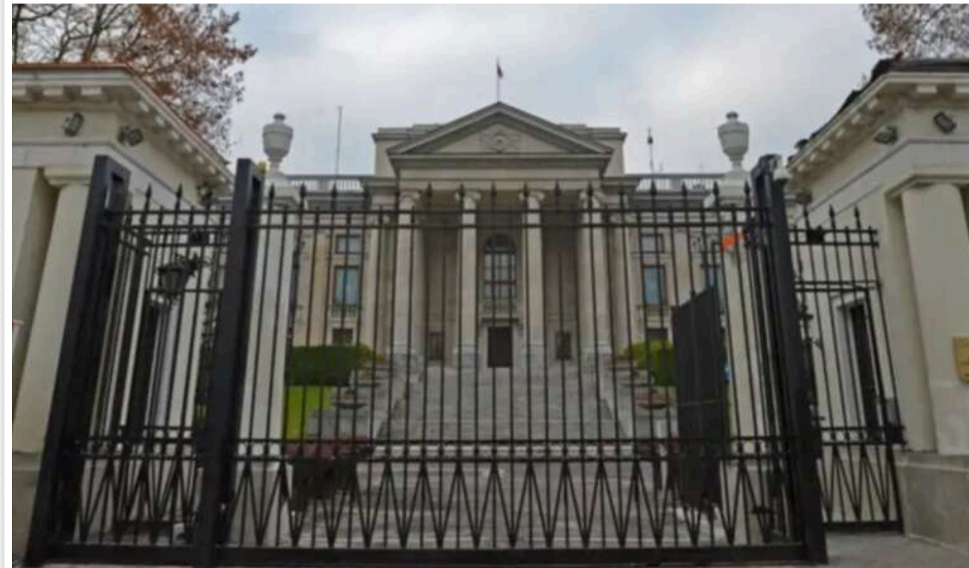
Троє дипломатів Росії покинуть Польщу після закриття консульства в Познані

Російське консульство в Познані, яке за рішенням МЗС Польщі припинить свою діяльність, покинуть троє дипломатів та п'ять адміністративно-технічних працівників.