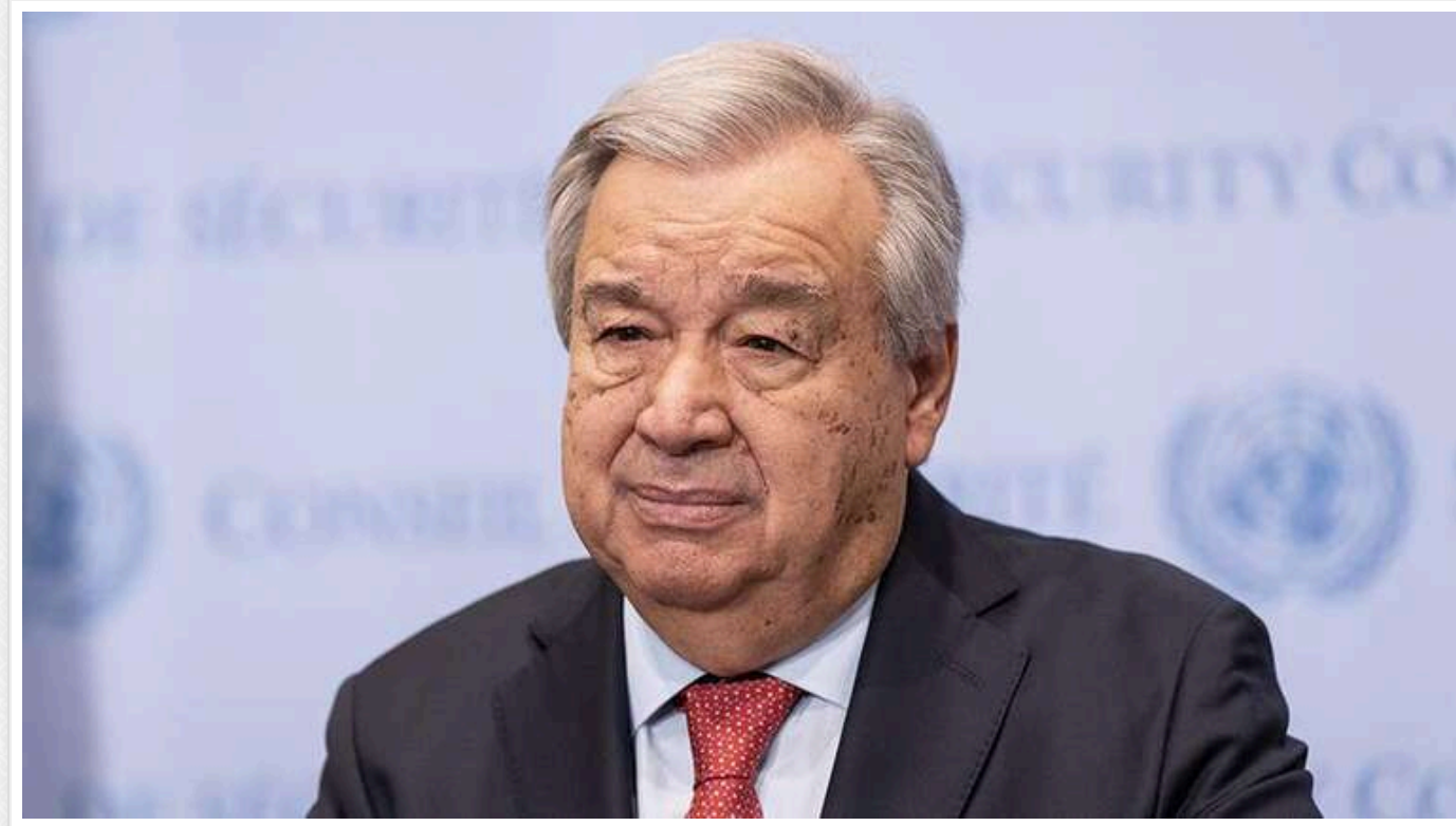
Генсек ООН Гутерреш на саміті БРІКС закликав до встановлення миру в Україні та реформування Радбезу ООН

Гутерреш зазначив, що всі поточні конфлікти у світі, включаючи ті, що відбуваються в Україні та Ізраїлі, слід вирішувати, "залишаючи вірність цінностям Статуту ООН, принципам верховенства права, територіальної цілісності та політичної незалежності всіх держав".