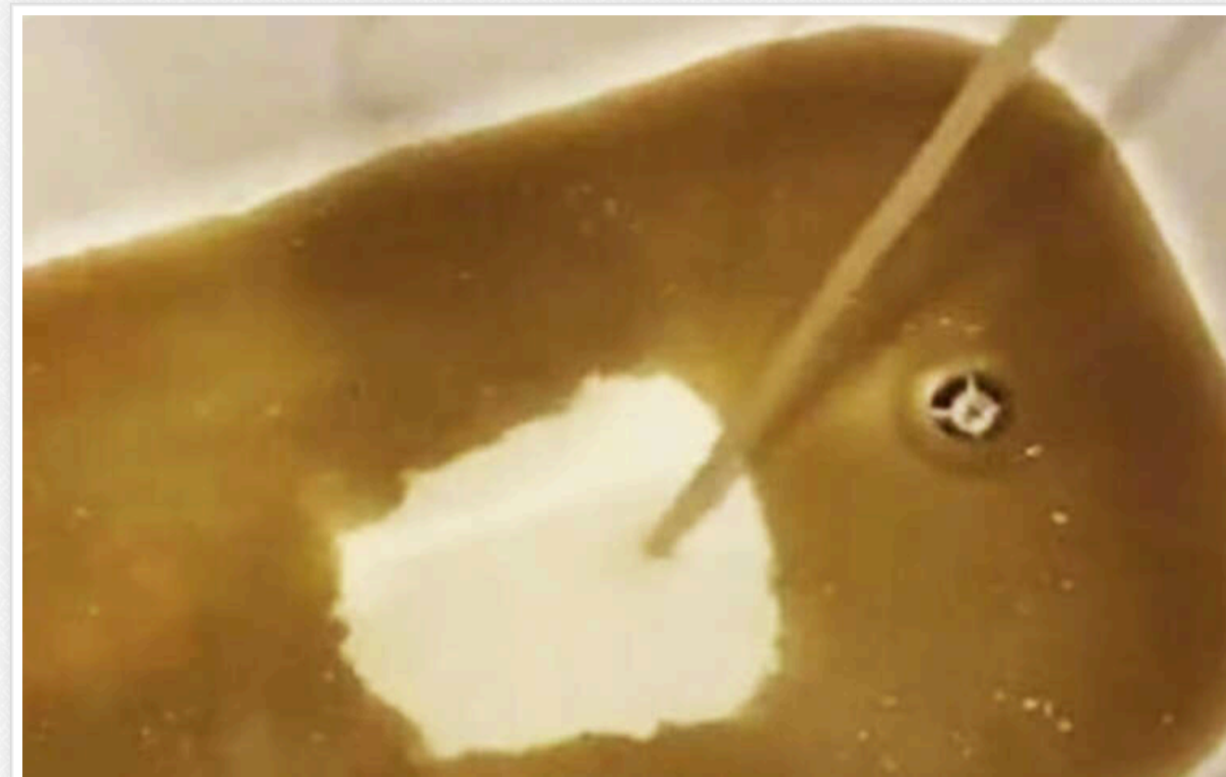
У захопленому Маріуполі місцеві жителі скаржаться на дуже погану якість водопровідної води

Жителі окупованого Маріуполя висловлюють невдоволення не лише частими відключеннями та аваріями, а й низькою якістю водопровідної води.