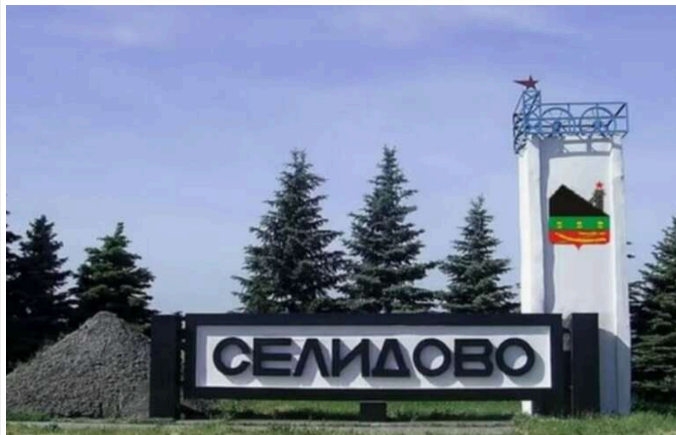
Військовий назвав найгарячіший напрямок на фронті

Російські сили змогли досягти прогресу в районі Селидово, що знаходиться в Донецькій області. Флангові бої тривають, окупанти намагаються заволодіти містом. Весь сектор охоплений активними бойовими діями.