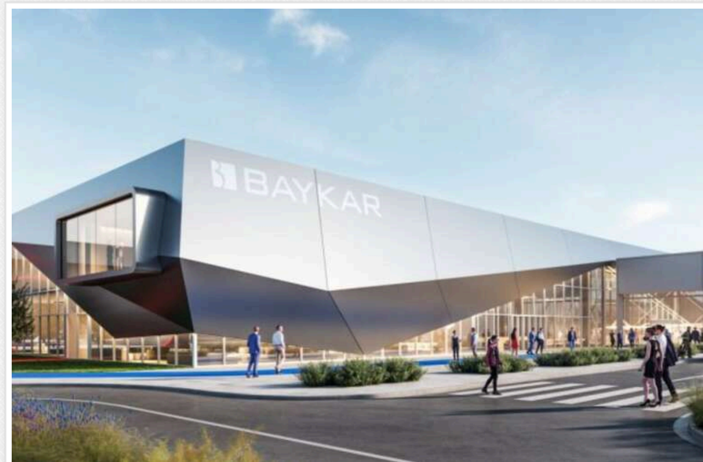
Reuters: Ваукар планує завершити зведення заводу з виробництва безпілотників в Україні до серпня 2025 року