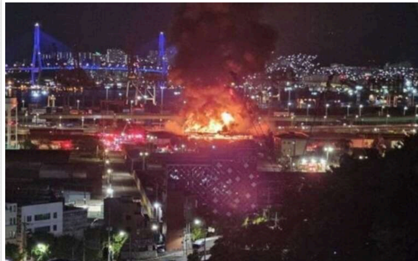
У Південній Кореї на складі армії США виникла потужна пожежа

Сьогодні, 24 жовтня, в Південній Кореї сталася пожежа на складі постачання армії США. Полум'я погасили приблизно за 4 години.