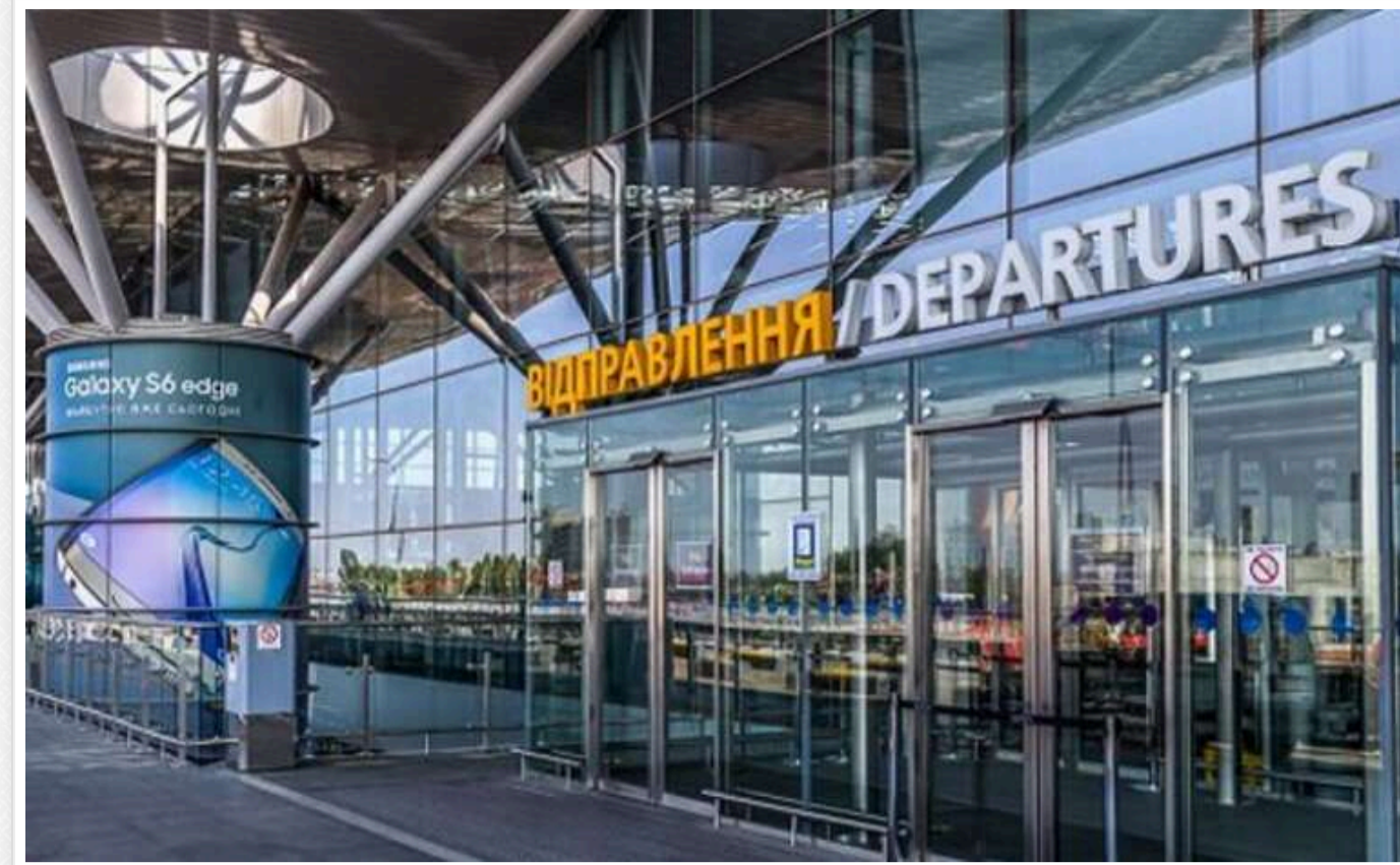
Непрацюючий аеропорт Бориспіль має намір витратити 13,7 мільйона гривень на закупівлю газу

Міжнародний аеропорт "Бориспіль" оголосив тендер на постачання природного газу. За блакитне паливо, яке має надходити державному підприємству щомісяця протягом двох років, воно готове заплатити майже 14 млн гривень.