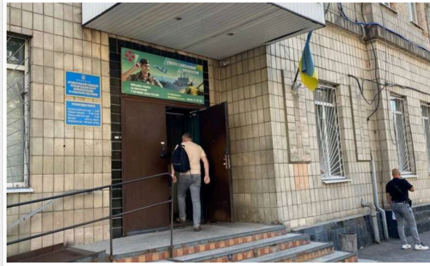
Виключені з військового обліку непридатні чоловіки мають з'являтися до ТЦК особисто

Коли чоловіка було виключено з військового обліку через рішення ВЛК про непридатність, що записано у військовому квитку, але ця інформація не з'являється в електронному Реєстрі військовозобов'язаних «Оберіг», то чоловіку слід подати документи особисто до ТЦК, тобто, з'явитися з оригіналами всіх документів, а не надіслати їх поштою. Таку позицію висловив Одеський окружний адміністративний суд у рішенні від 8 жовтня по справі № 420/21694/24.