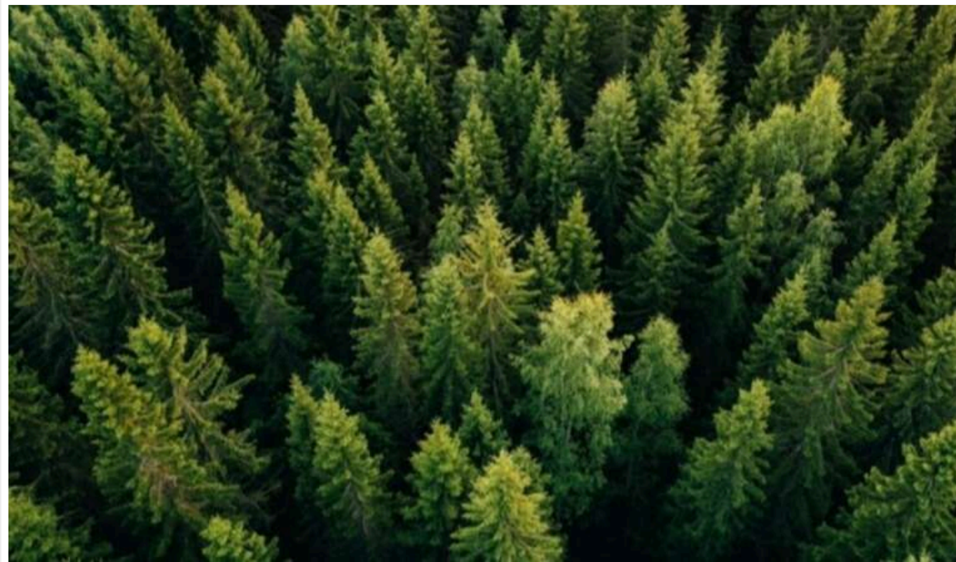
Експосадовця ОДА викрили на хабарі в 200 тисяч доларів

Національне антикорупційне бюро та Спеціалізована антикорупційна прокуратура повідомили колишньому заступнику голови обласної державної адміністрації про підозру у вимаганні неправомірної вигоди за виділення приватному товариству лісової ділянки у довготривале користування.