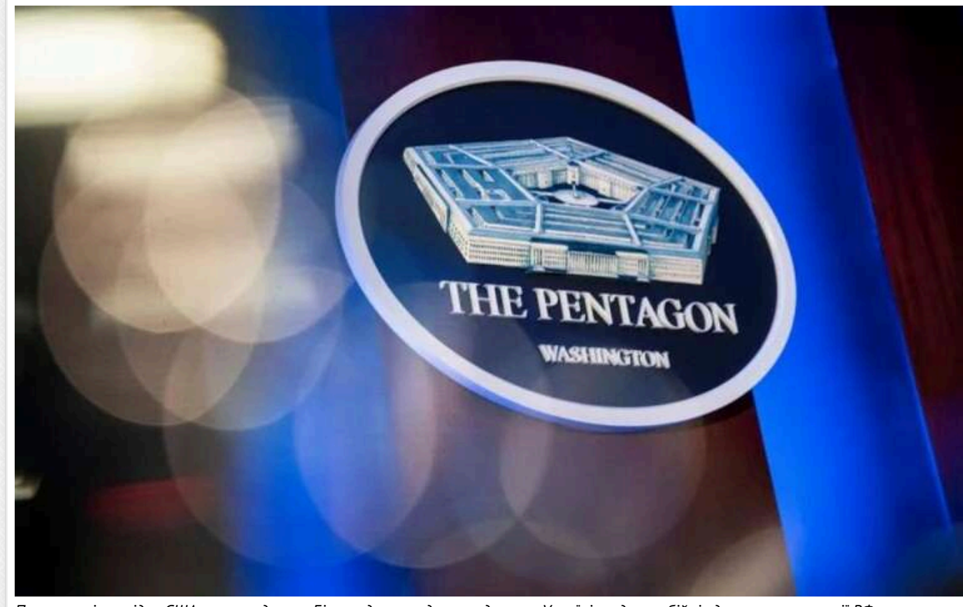
Пентагон і розвідка США рекомендували Білому дому не давати дозволу Україні на далекобійні удари по території РФ