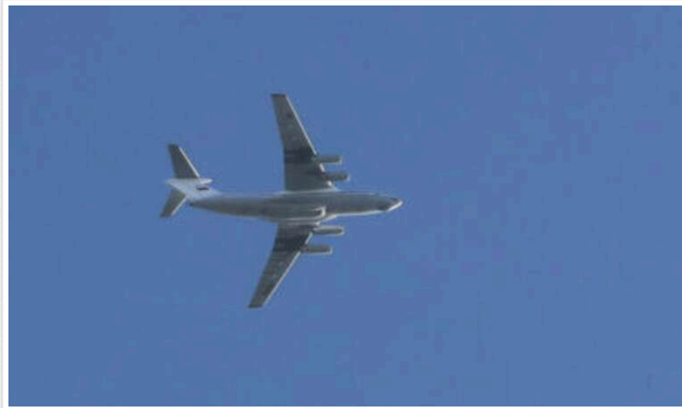
Reuters: На літаку, збитому в Судані, міг перебувати російський бізнесмен, який займався продажем зброї в Конго