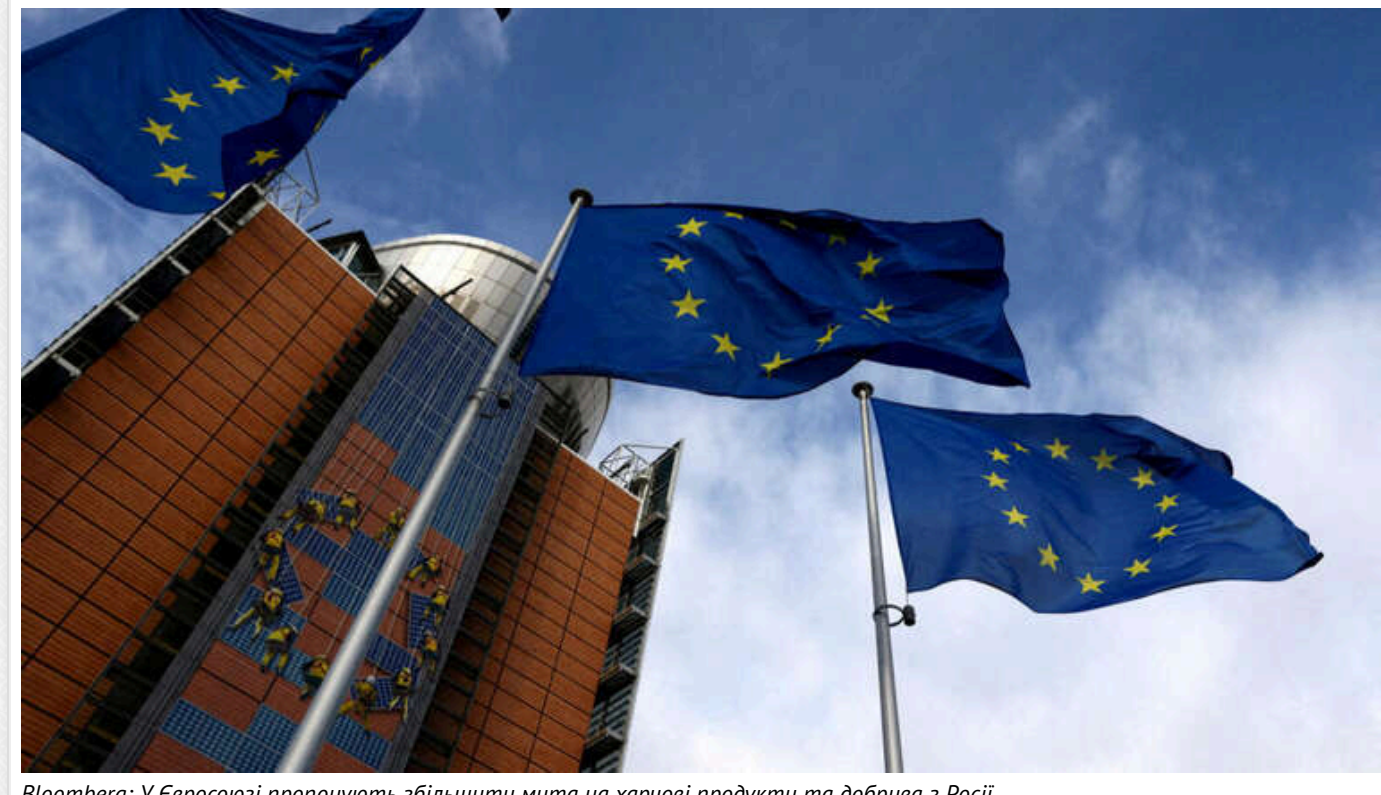
Bloomberg: У Євросоюзі пропонують збільшити мита на харчові продукти та добрива з Росії

Деякі країни Європейського Союзу закликають блок збільшити мита на російські сільськогосподарські та продовольчі товари, а також на добрива.