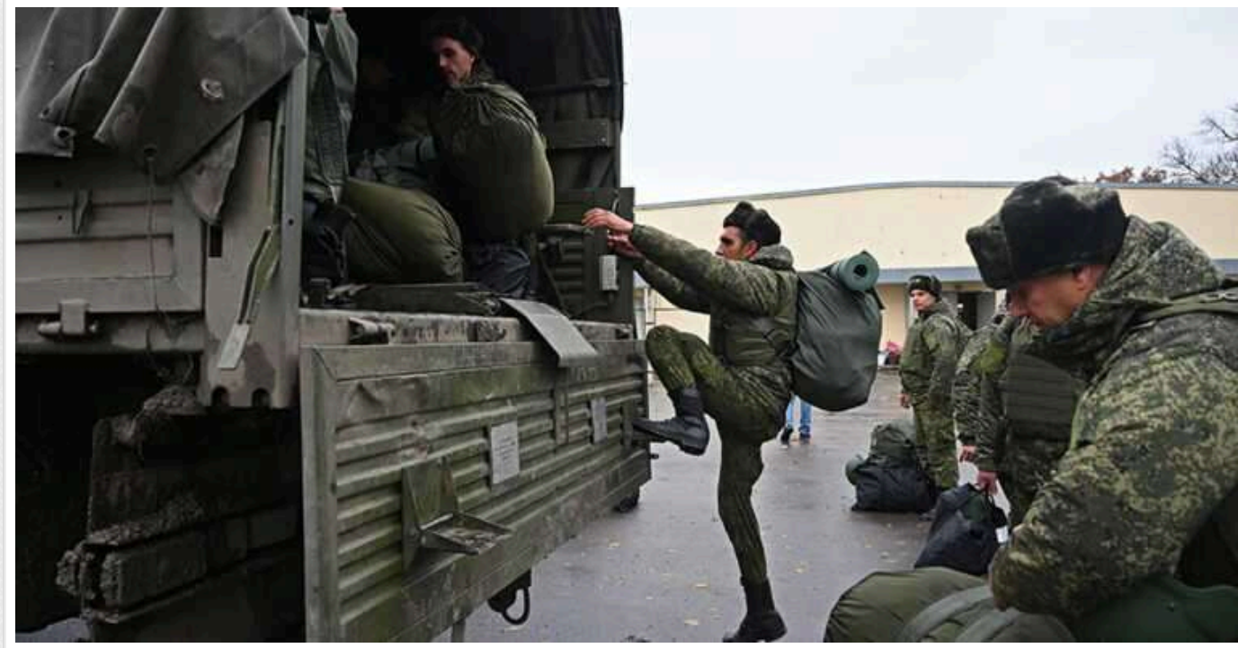
Окупанти на Куп'янському напрямку намагаються створювати переправи поблизу річки Оскіл

На Куп'янському напрямку фронту російська армія намагається наводити переправи біля річки Оскіл.