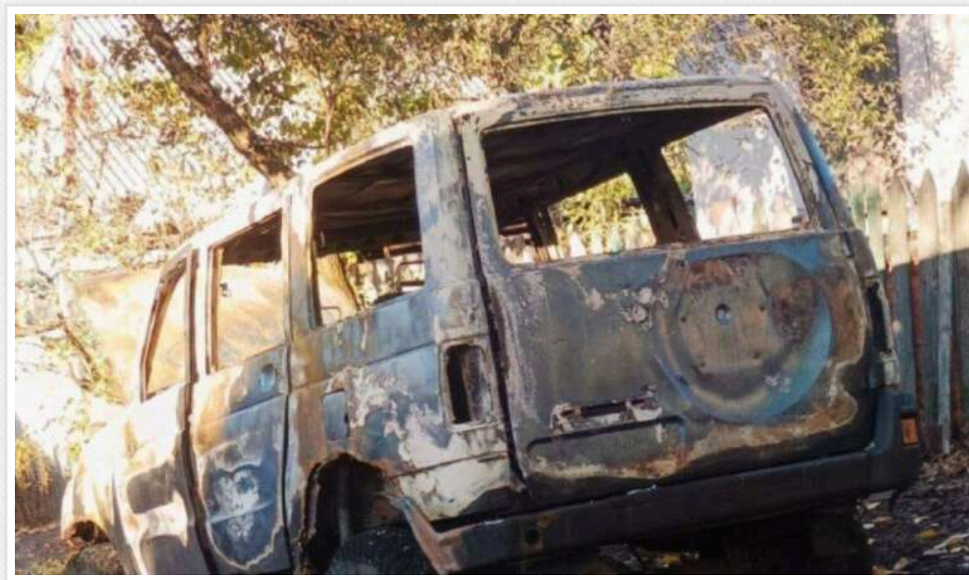
На окупованій Донеччині партизани підпалили військовий автомобіль росіян з важливими документами

На окупованій території Донеччини у селищі Залісне партизани знищили військове авто росіян з важливими документами.