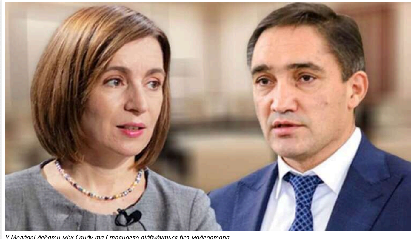
У Молдові дебати між Санду та Стояногло відбудуться без модератора

Дебати перед другим туром виборів президента Молдови між Маєю Санду та Олександром Стояногло відбудуться 27 жовтня. Розмова кандидатів пройде без модератора.