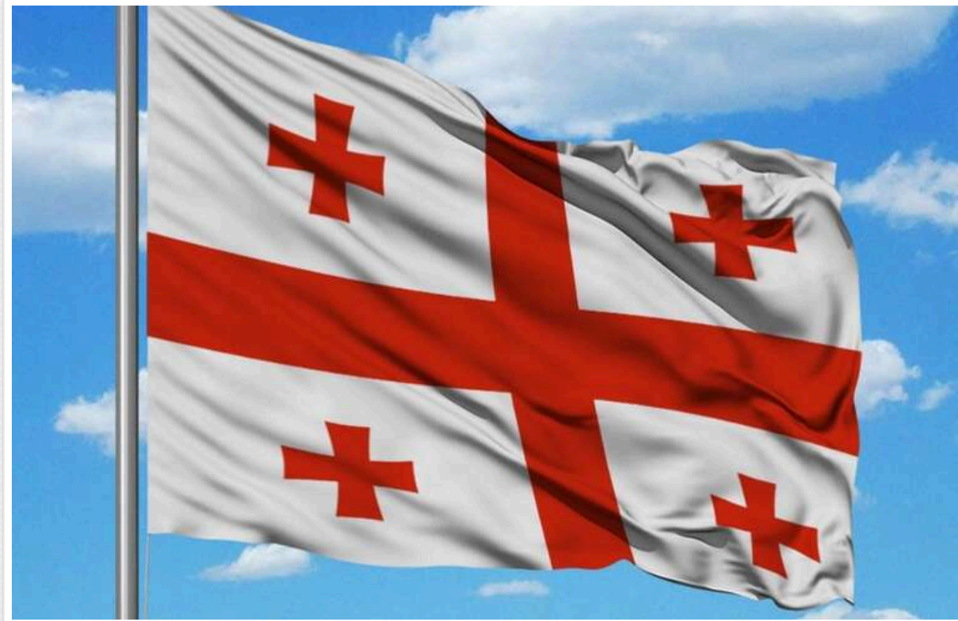
Грузинська опозиція суттєво випереджає проросійську партію, - опитування

Грузинські опозиційні партії у сукупності можуть набрати більша частина голосів на майбутніх парламентських виборах. Проросійська "Грузинська мрія" сильно відстає.