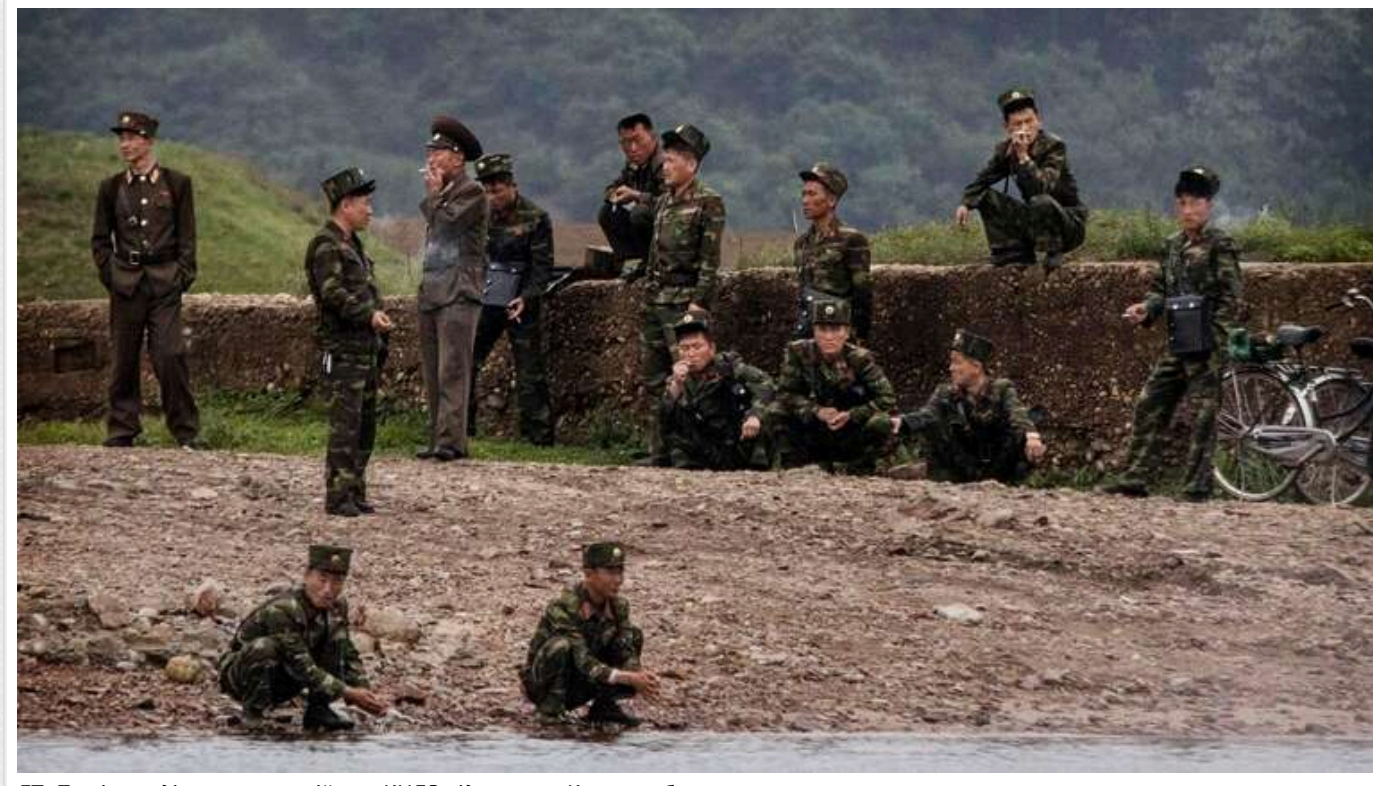
FT: Путін сподівається що війська КНДР відвоюють Курську область

Північнокорейські війська, що перебувають у Росії, можуть бути перекинуті до Курської області. Російський диктатор Володимир Путін сподівається, що вони допоможуть відбити частину області, яку наразі контролюють ЗСУ.