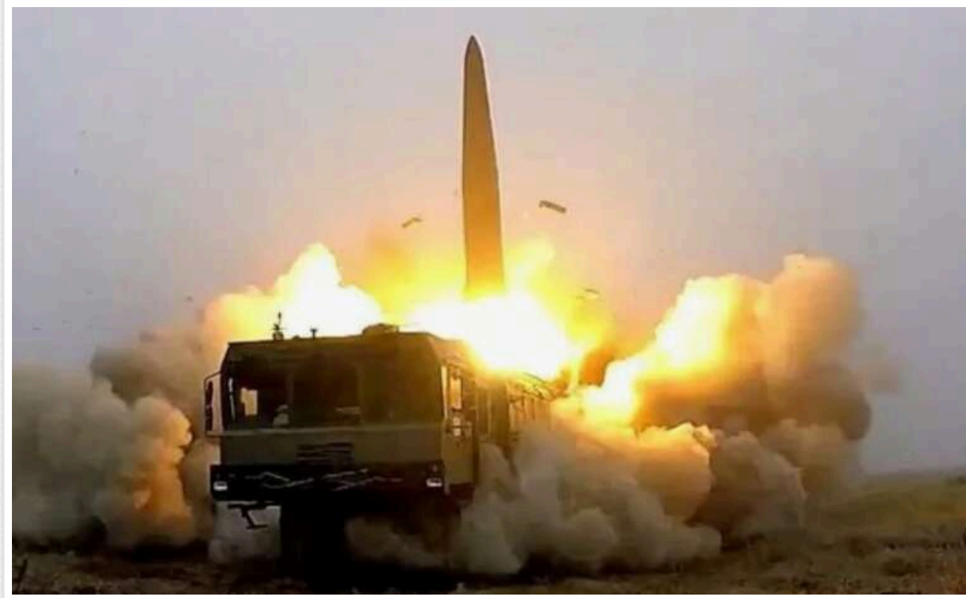
РФ випустила по Україні понад 11 тисяч ракет, — CSIS

Завдяки постачанню західних систем ППО та українським розробкам, Сили оборони загалом перехопили 79,8% російських ракет.