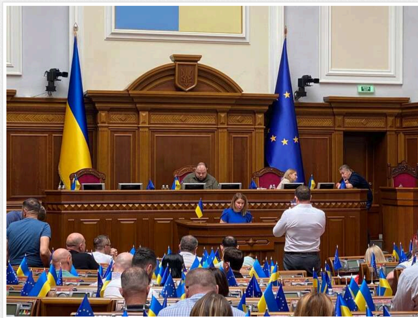
В Верховну Раду внесли законопроект про звільнення в запас

Українці віком 18–25 років, які вважалися обмежено придатними, але потрапили до армії, зможуть піти в запас, якщо буде прийнятий новий законопроект, запропонований народними депутатами. Закон, що забороняє призов цієї категорії громадян, поки ще не підписаний президентом.