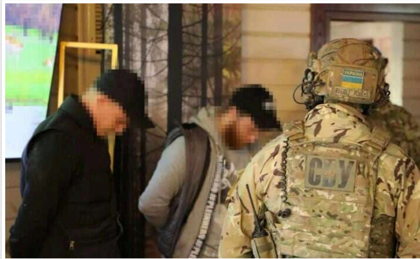
У Черкасах СБУ та Нацполіція затримали банду рекетирів, які тероризували мешканців

Служба безпеки та Національна поліція знешкодили злочинну групу, що тероризувала та намагалася тримати у страху жителів Черкас. Зловмисники вимагали гроші від місцевих підприємців, стверджуючи про повернення уявних боргів.