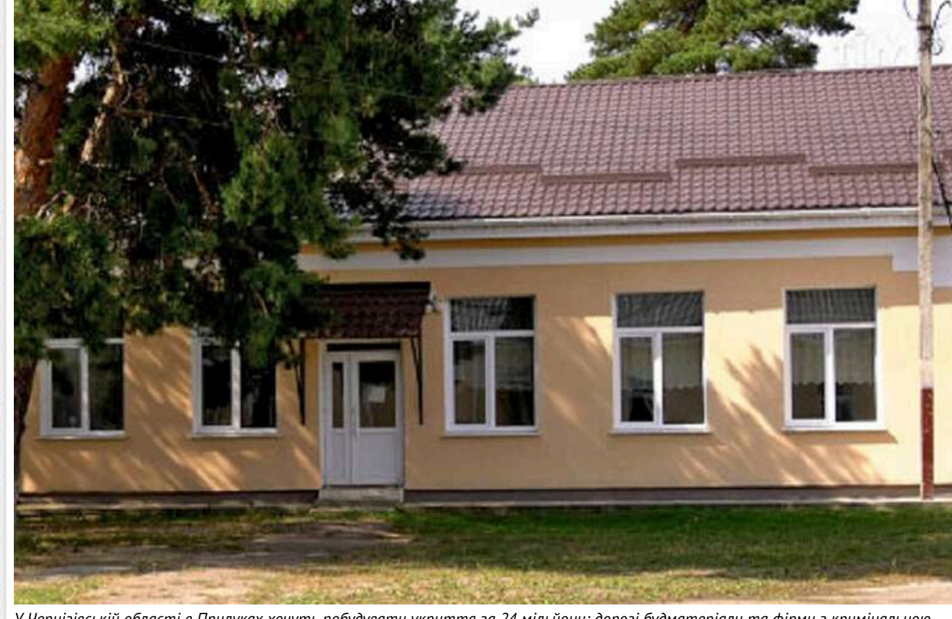
У Чернігівській області в Прилуках хочуть побудувати укриття за 24 мільйони: дорогі будматеріали та фірми з кримінальною справою

Управління ЖКГ Прилуцької міської ради Чернігівської області 10 жовтня за результатами тендери замовило ПП «МПБП Стимул» будівництво укриття Прилуцького ліцею №13 за 24,28 млн грн.