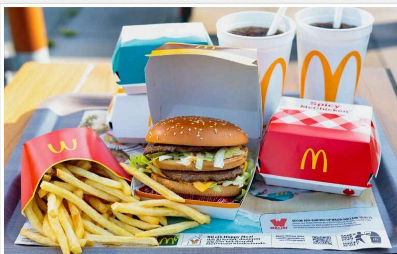
Після масового отруєння акції McDonald's впали на 9%

У кількох штатах США спалахнула кишкова інфекція через роял чизбургери з McDonald's.