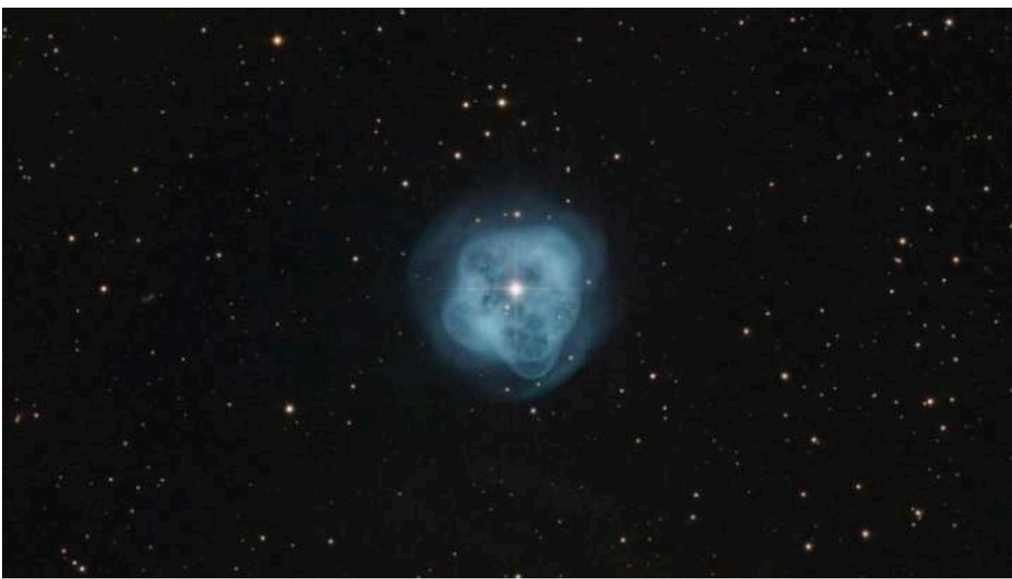
Фото: Crystal Ball Nebula

Астрономи опублікували знімок подвійної системи NGC 1514, зроблений телескопом Gemini North на піку Мауна-Кеа на Гаваях. Зображення показує вираючу зірку, оточену газовою хмарою, що світиться.