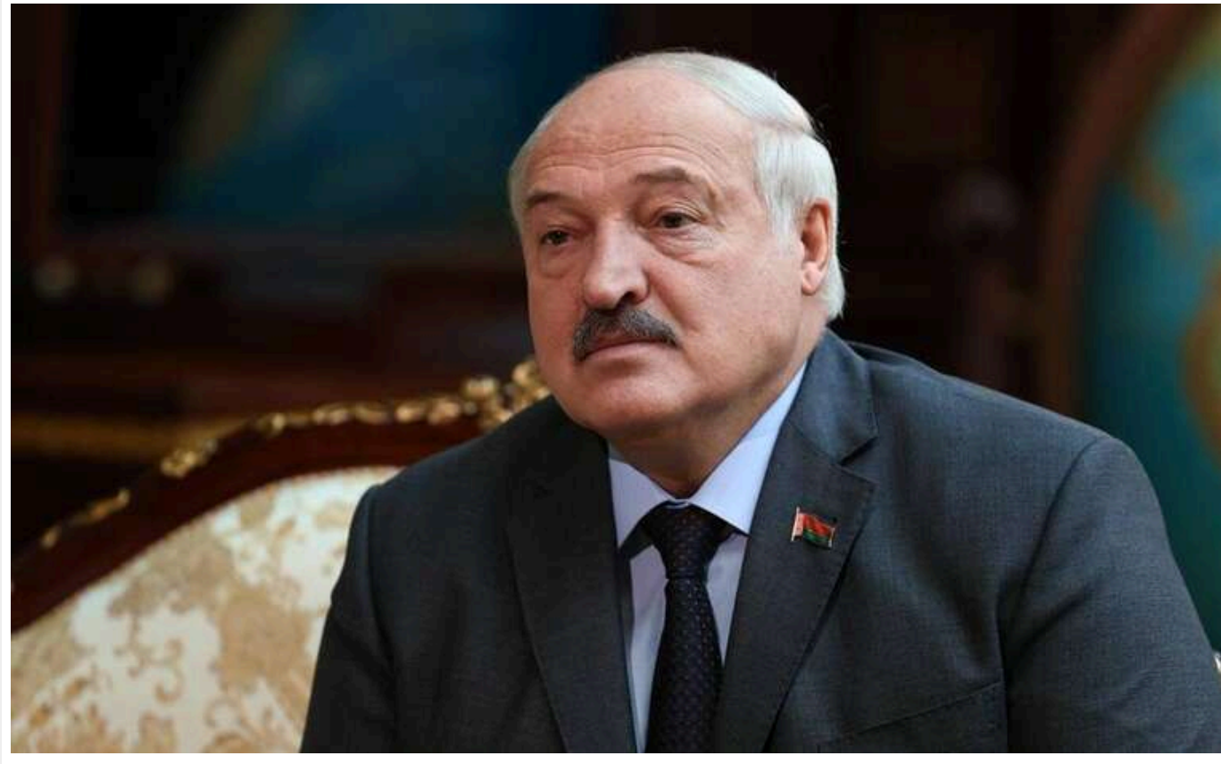
Лукашенко дозволить Путіну застосувати ядерку, яку привезли до Білорусі