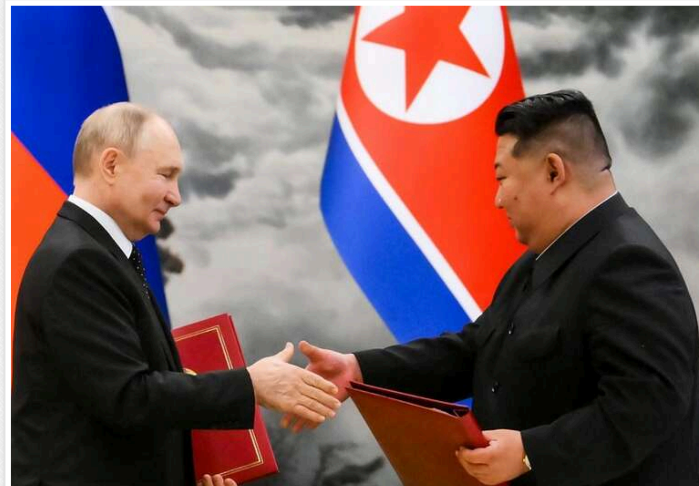
В РФ ратифікували Договір про всеосяжне стратегічне партнерство з КНДР

Державна Дума Російської Федерації затвердила угоду про всебічну стратегічну співпрацю між Росією та Північною Кореєю.