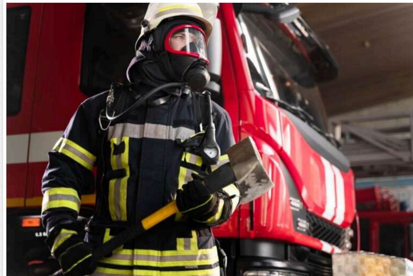
На Хмельниччині внаслідок ворожої атаки пошкоджено багатопверхівку й готель

У ніч на 24 жовтня під час дронавої атаки РФ у Старокостянтинові на Хмельниччині було пошкоджено багатопверхівку та дах готелю. В області було зафіксовано ще кілька пошкоджень, також постраждала одна людина.