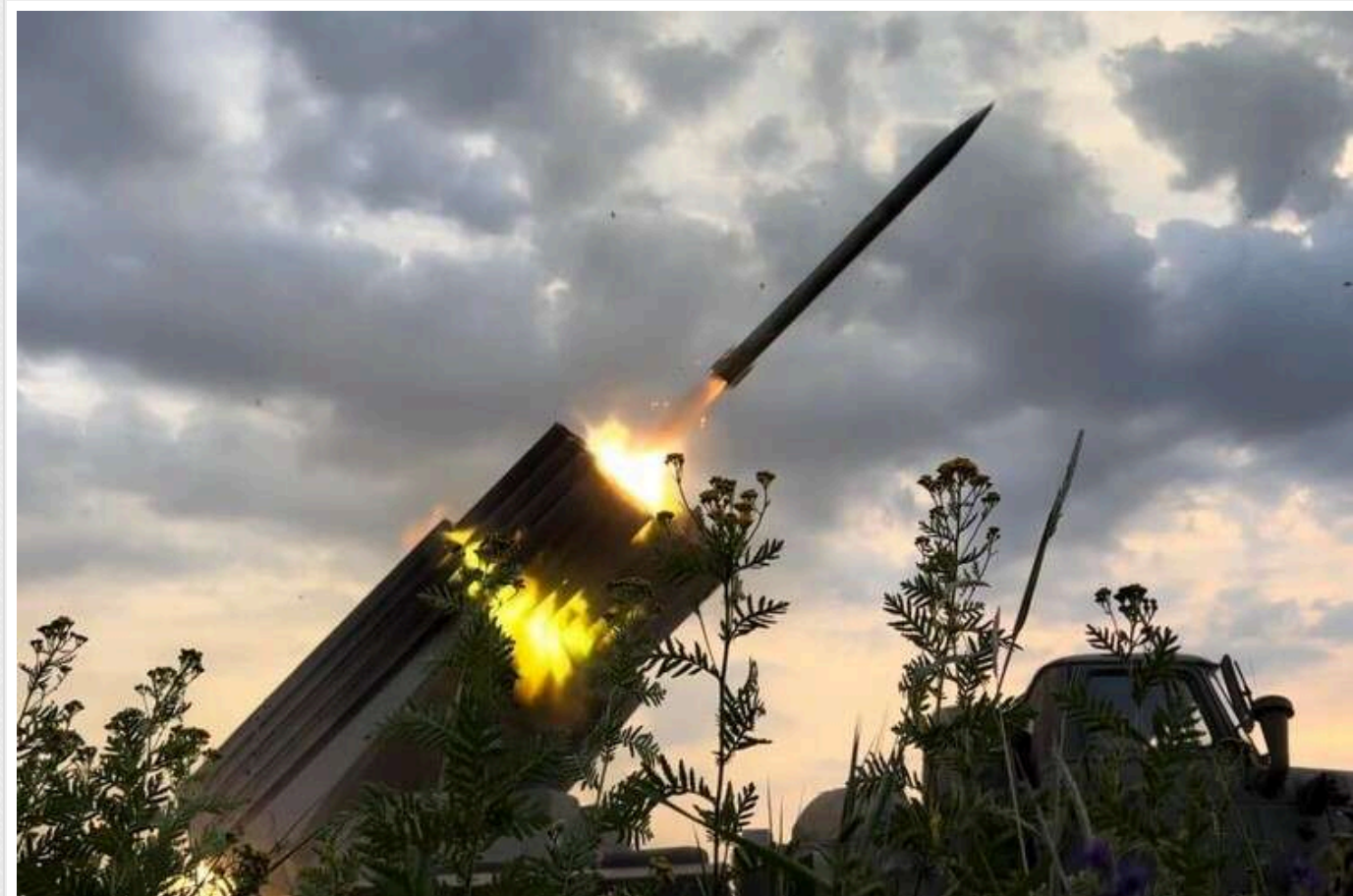
Загарбники завдали ударів по Куп'янську: є руйнування і постраждали

Вранці 24 жовтня російська терористична армія здійснила атаку на Куп'янськ у Харківській області. Внаслідок обстрілу були поранені мирні жителі.