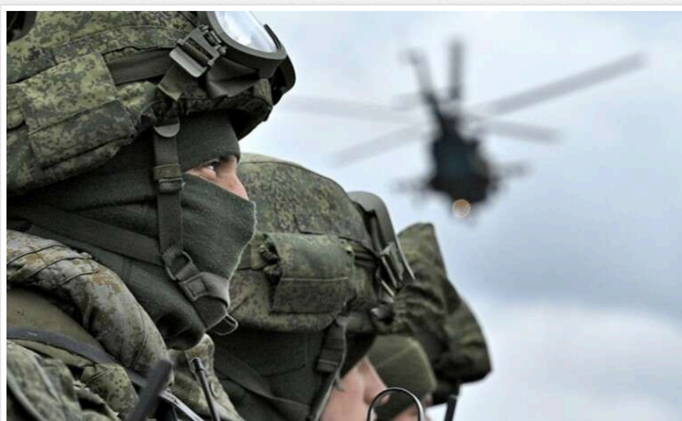
Окупанти закріплюються в багатопверхівках в Селидовому

Росіяни закріплюються в багатопверхових будівлях у центрі Селидового, де раніше був основний укріпрайон ЗСУ, повідомляють українські військові.