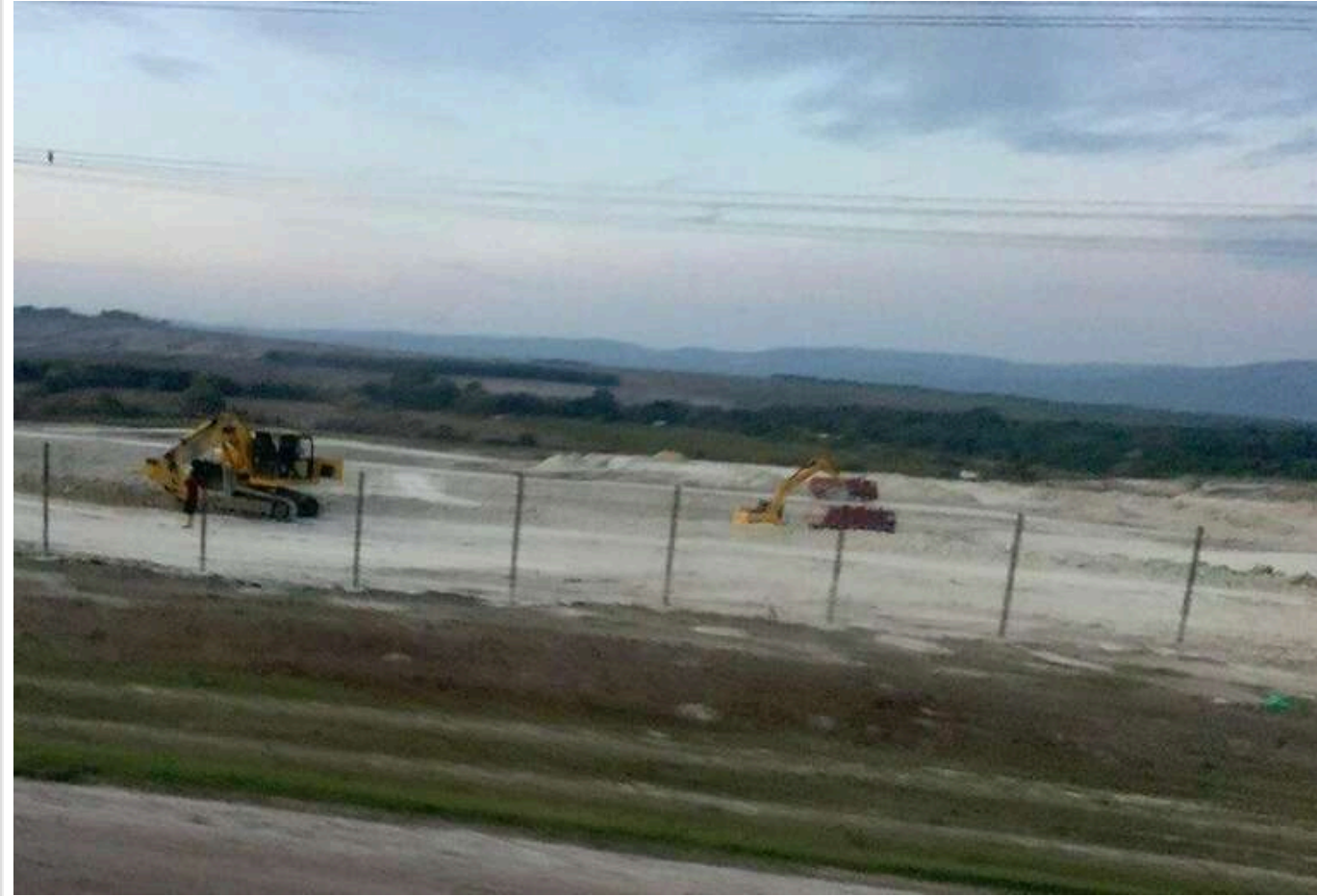
Росіяни будують новий склад боєприпасів під Новоросійськом

Агенти руху опору «АТЕШ» виявили зведення нового складу боєприпасів російських сил під Новоросійськом.