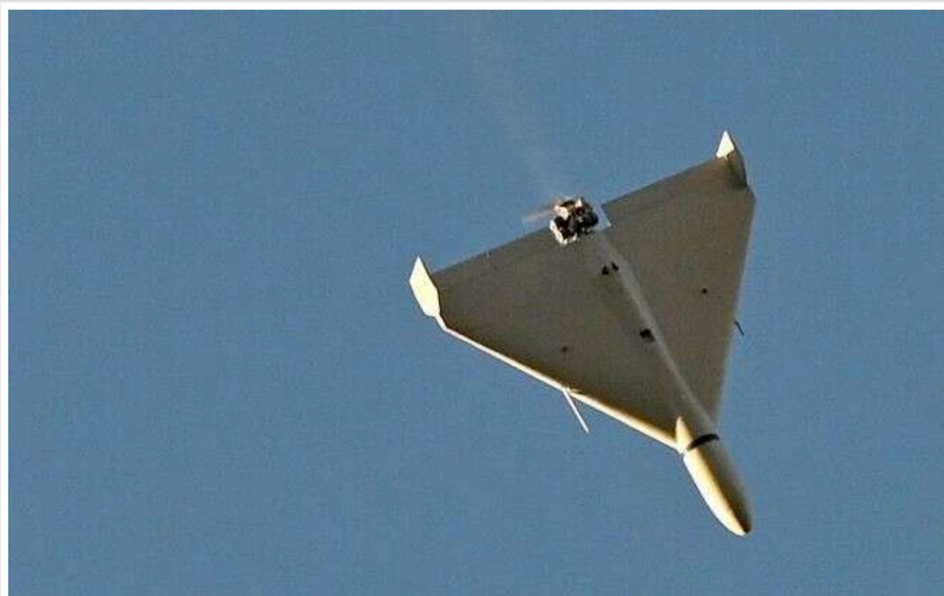
У КОВА розповіли про наслідки чергової російської атаки на Київщину

У ніч з 23 на 24 жовтня Росія знову атакувала Київщину за допомогою дронів-камікадзе. Тривога тривала понад 9 годин, а уламками збитих об'єктів було пошкоджено вікна в будівлях двох підприємств і трансформаторний корпус.