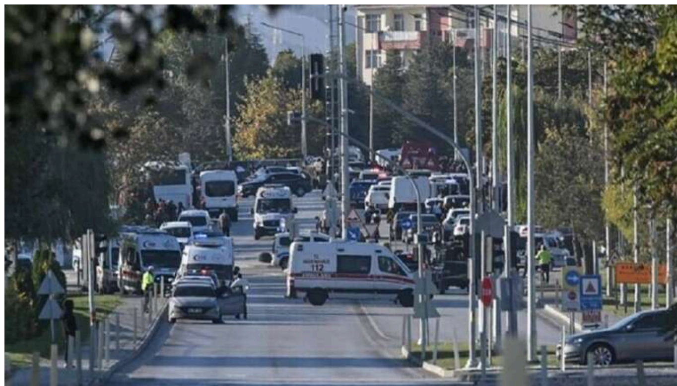
Теракт у Туреччині: кількість загиблих зросла до 5

Міністерство внутрішніх справ Туреччини розкрило деталі теракту в Анкарі: кількість загиблих зросла до 5.