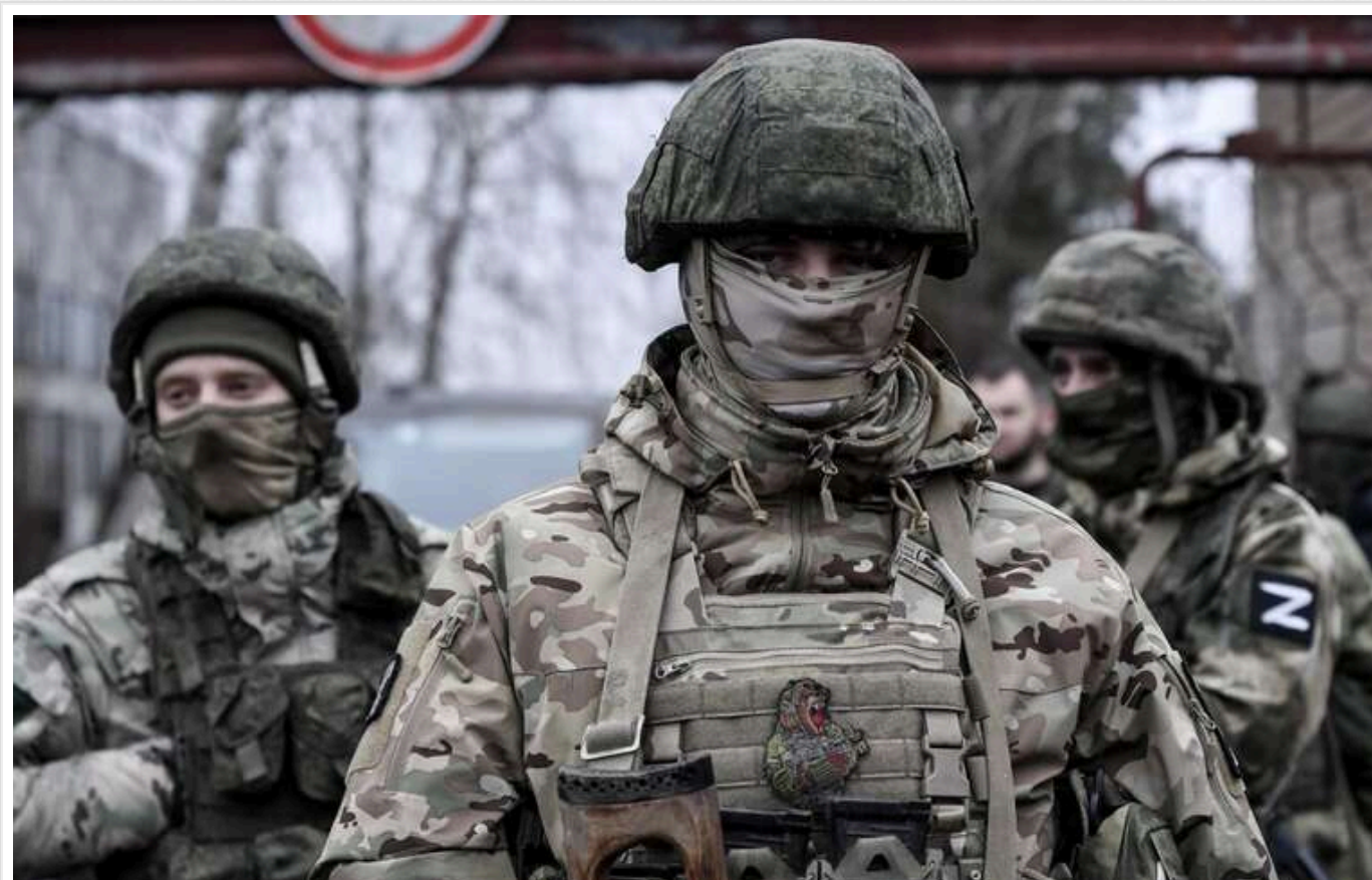
ISW: Концентрація росіян на Селидовому уповільнює захоплення Покровська

Останніми днями російська армія досягла тактичних успіхів у захопленні міста Селидове та його околиць у Донецькій області. Однак зосередження противника на південному напрямку значно уповільнює можливу окупацію Покровська.