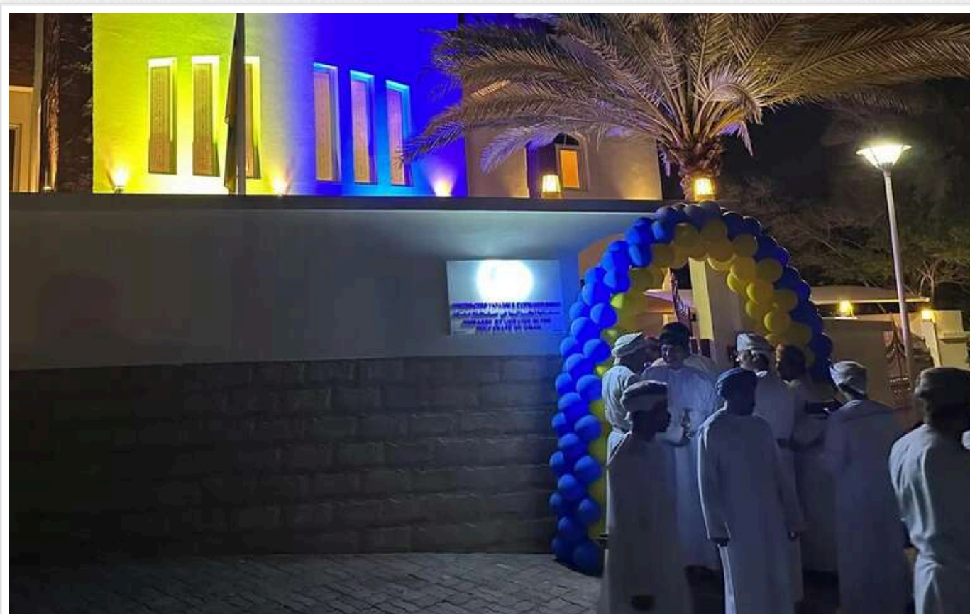
У Султанаті Оман відкрили посольство України

У столиці Оману Маскаті відбулося відкриття нової закордонної дипломатичної установи нашої країни - Посольства України в Султанаті Оман. Заклад урочисто відкрили міністри закордонних справ України Андрій Сибіга та Оману Бадр бін Хамад Аль-Бусаїді.