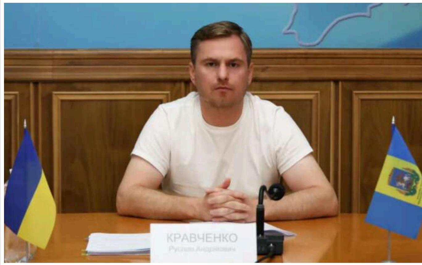
В ОП визначилися з кандидатурою нового генпрокурора, – ЗМІ