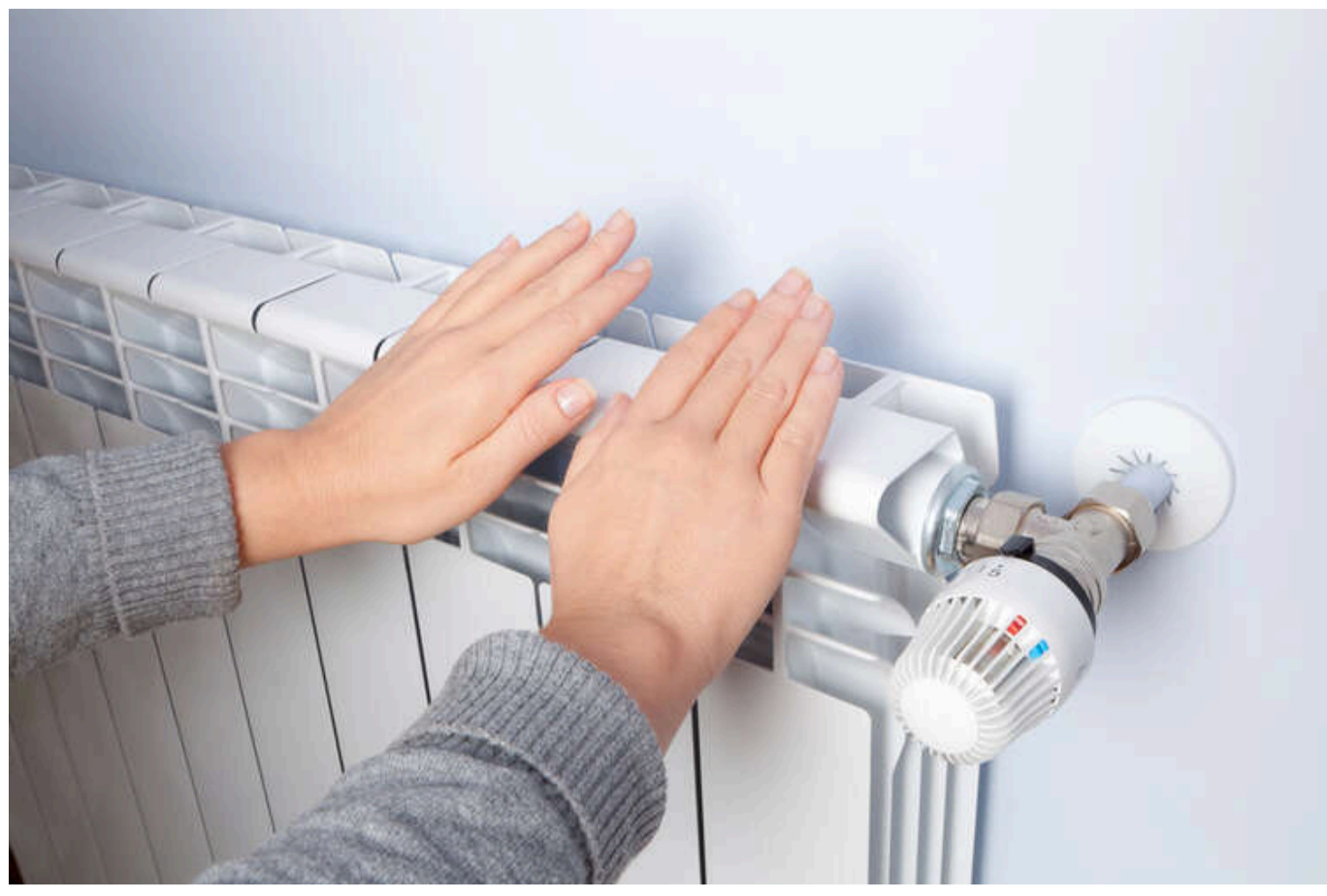
У Черкасах комунальники перестануть приймати скарги

Комунальне підприємство "Черкаситеплокомуненерго" планує розпочати подачу опалення для жителів міста. У зв'язку з цим черкащани вже були попереджені, що перший час скарги на якість послуг не прийматимуться.