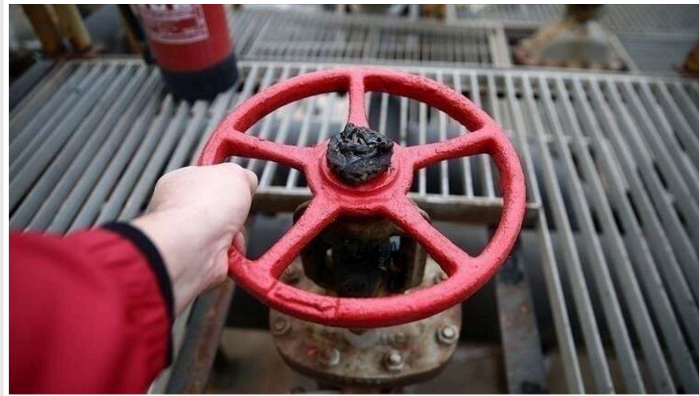
Євросоюз не може скоротити постачання російського газу, що ставить під загрозу плани Союзу відмовитися від пального з Росії до 2027 року

Про це повідомляє оглядач Bloomberg Ксає'єр Блас.