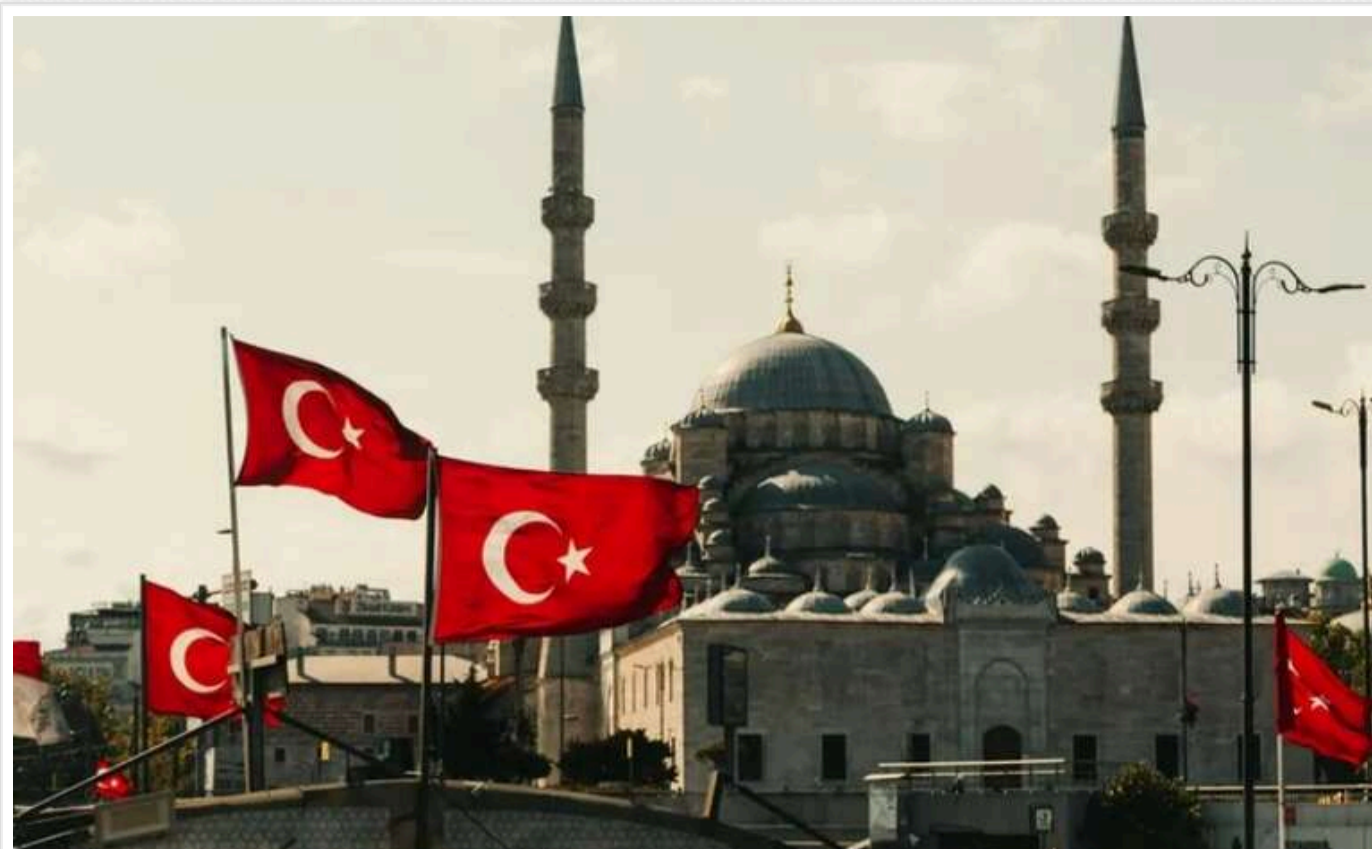
Туреччина завдала сильного удару по торгівлі з Росією

Турецька влада запровадила митні бар'єри, що перешкоджають імпортування з Туреччини до Росії американських військових технологій. Це стало результатом попередження з боку Білого дому Анкари про можливі наслідки такої торгівлі.