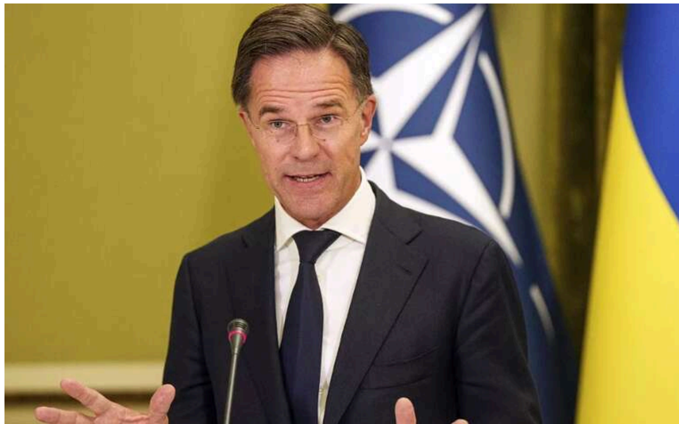
Рютте: Незалежно від того, хто переможе на виборах, Альянс буде співпрацювати зі Сполученими Штатами у підтримці України

НАТО продовжить співпрацю зі США щодо підтримки України, незалежно від того, хто очолить нову адміністрацію після виборів у Сполучених Штатах. Усі країни Альянсу дуже мотивовані продовжувати надавати допомогу Києву.