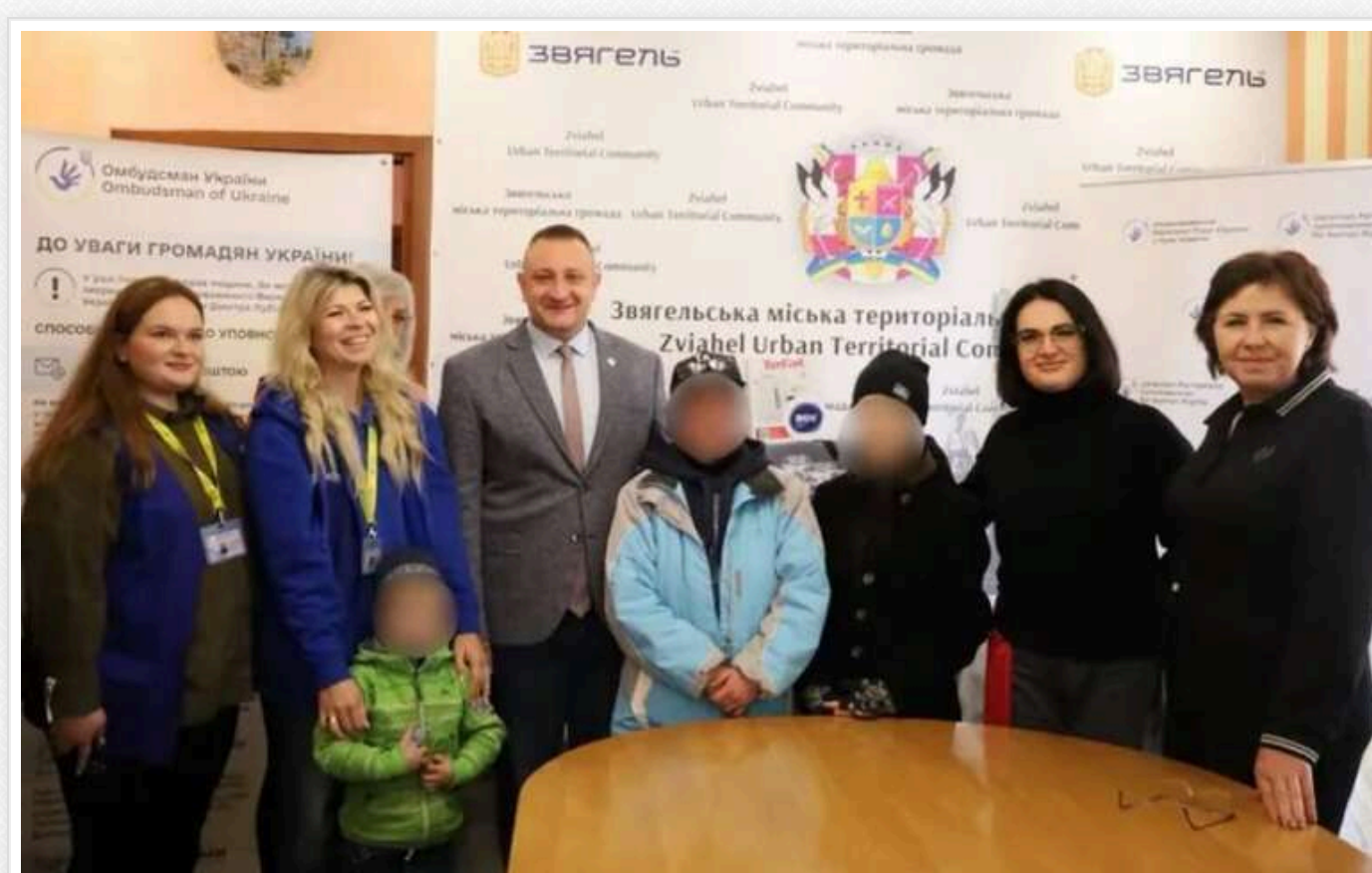
Ще шістьох дітей вдалося повернути на територію, контрольовану Україною

На територію України, підконтрольну уряду, вдалося повернути ще шістьох дітей віком від 3 до 17 років. П'ять сімей змогли виїхати з тимчасово окупованих населених пунктів Херсонської, Запорізької областей і Криму.