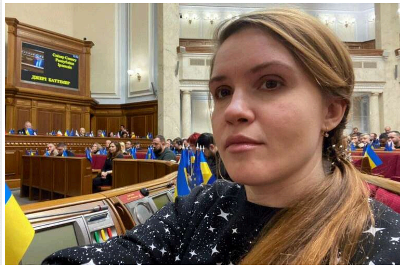
Нардеп Безугла повідомила, що шукає адвоката для судового розгляду з Федієнко

Народна депутатка Мар'яна Безугла (позафракційна, київський округ №217, Оболонь) оголосила про пошук адвоката для судового розгляду з іншим народним депутатом - Олександром Федієнком («Слуга народу»).